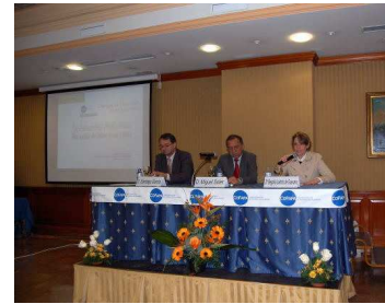
La presidenta de COFAPA, junto al ponente y al moderador