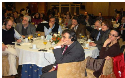
Acudieron destacados representantes de los sindicatos de la educación.