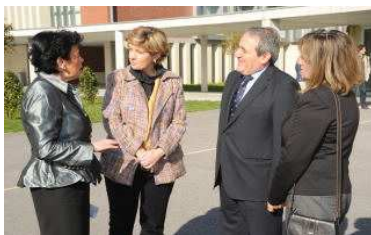
La Consejera de Educación del Gobierno Vasco junto a la Directora del colegio Ayalde, el Director General de COAS y la Viceconsejera de Educación-