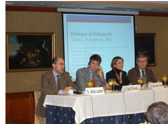
El ponente junto al moderador y a los Presidentes de COFAPA y CONCAPA